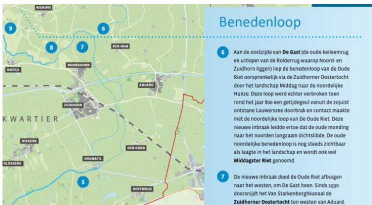
Deel van een paneel uit de tentoonstelling over de Oude Riet in het Wierdenmuseum in 2021. In lichtblauw de beide reststromen ten oosten van Zuidhorn en Noordhorn

Aanknopingspunt voor onze Stichting Beekdal-landschap Oude Riet is dat deze wijk komt te liggen in het voormalige Oude Riet dal. De gemeentelijke stukken zijn dubbelzinnig: enerzijds staat er dat de Oude Riet hier sinds 1990 is verdwenen, anderzijds dat in de bodem en in het reliëf de Oude Riet nog te herkennen is. Onzes inziens zijn Zuider- en Oostertocht restanten van de Oude Riet en is er zeker sprake van het voormalige Rietdal, waar eeuwen lang een beek en een zeearm stroomden. Zie bijlage 1.